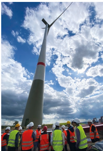
Die Windkraftanlagen von Enercon erreichen je Anlage eine Gesamthöhe von 247 m, eine Nabenhöhe von 166 m, einen Rotor-Durchmesser von 160 m und bringen es auf ein Gesamtgewicht von 3000 Tonnen. Damit produziert eine Anlage pro Jahr bis zu 20 Mio kWh.

Auf dem Gelände zwischen den rheinhesischen Orten Gau-Bickelheim, Armsheim und Flonheim wird ein bestehender Windpark mit insgesamt 18 Anlagen im Zeitraum von 2022 bis 2025 sukzessive mit modernen Anlagen von Enercon (Typ E-160 EP5) erneuert. Am 4. Juli 2024 lud die Ingenieurkammer Rheinland-Pfalz ihre Mitglieder im Rahmen des talkING-Formats zur Besichtigung der Windpark-Baustelle nach Gau-Bickelheim ein. Rund 30 Mitglieder nahmen an der beeindruckenden Führung durch die einzelnen Stationen der Installation einer Windkraftanlage teil. Dipl.-Ing. Torsten Höllwarth von wivi consult GmbH & Co. KG und ebenfalls Kammermitglied als Beratender Ingenieur übernahm die Führung durch die große Baustelle.