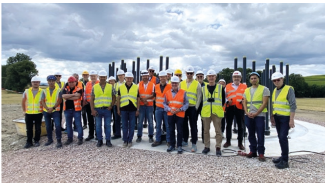
Die Teilnehmer der Windparkbesichtigung in Gau-Bickelheim.