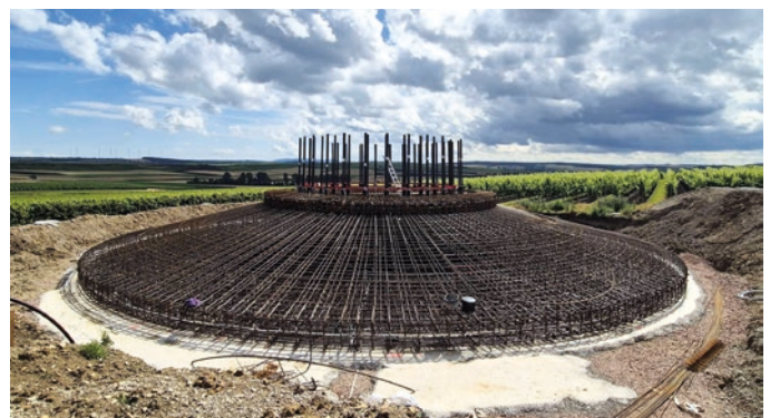
Das Stahlbetonfundament mit 24 m Durchmesser und einem Volumen von 850 m 3 bei einer Höhe von 2,8 m, hergestellt aus Ortbeton der Güteklassen C40/50 und C30/37.