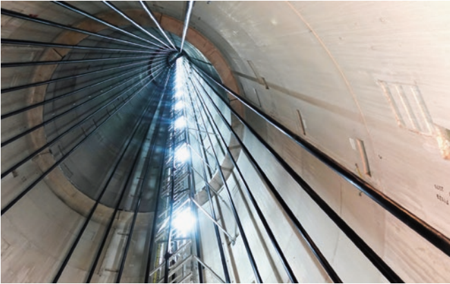
Der spektakuläre Blick in das Innenleben einer Windkraftanlage.