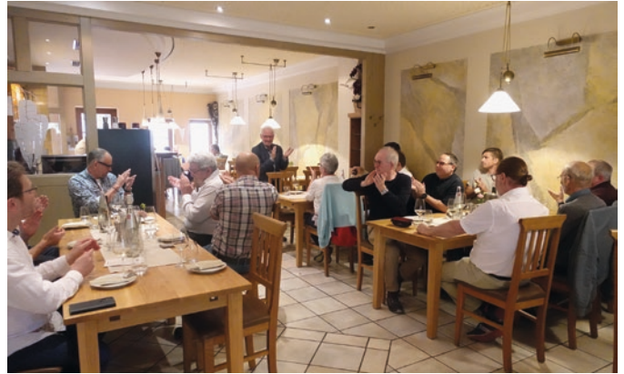
Der Ausklang des Abends fand im Weinhotel Esper im benachbarten Flonheim statt.

Die Besonderheit in Rheinhessen sei auch, dass hier sogenannte Schwachwind-Anlagen eingesetzt werden, die sich durch einen großen Rotordurchmesser und eine hohe Nabenhöhe auszeichnen. Anders sei das an der Küste, da dort durch die vorherrschenden starken Windbedingungen, kleinere Rotordurchmesser ausreichen, die entsprechend mit einer höheren Drehzahl laufen.