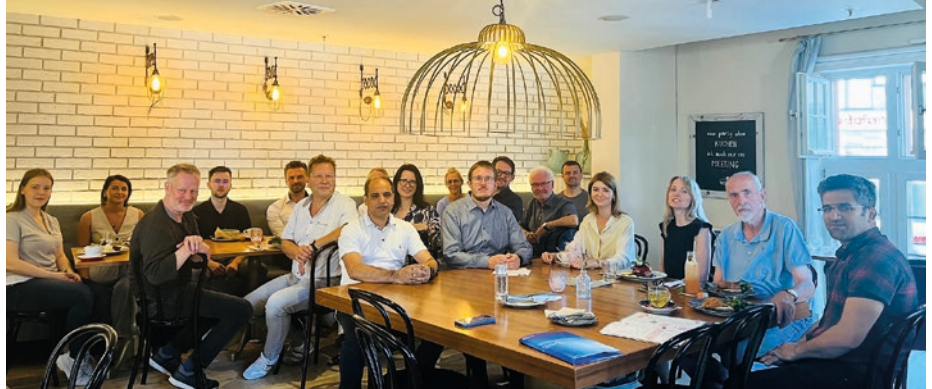
Das Neumitgliederfrühstück fand im Mainzer Lokal „Wilma Wunder“ statt.